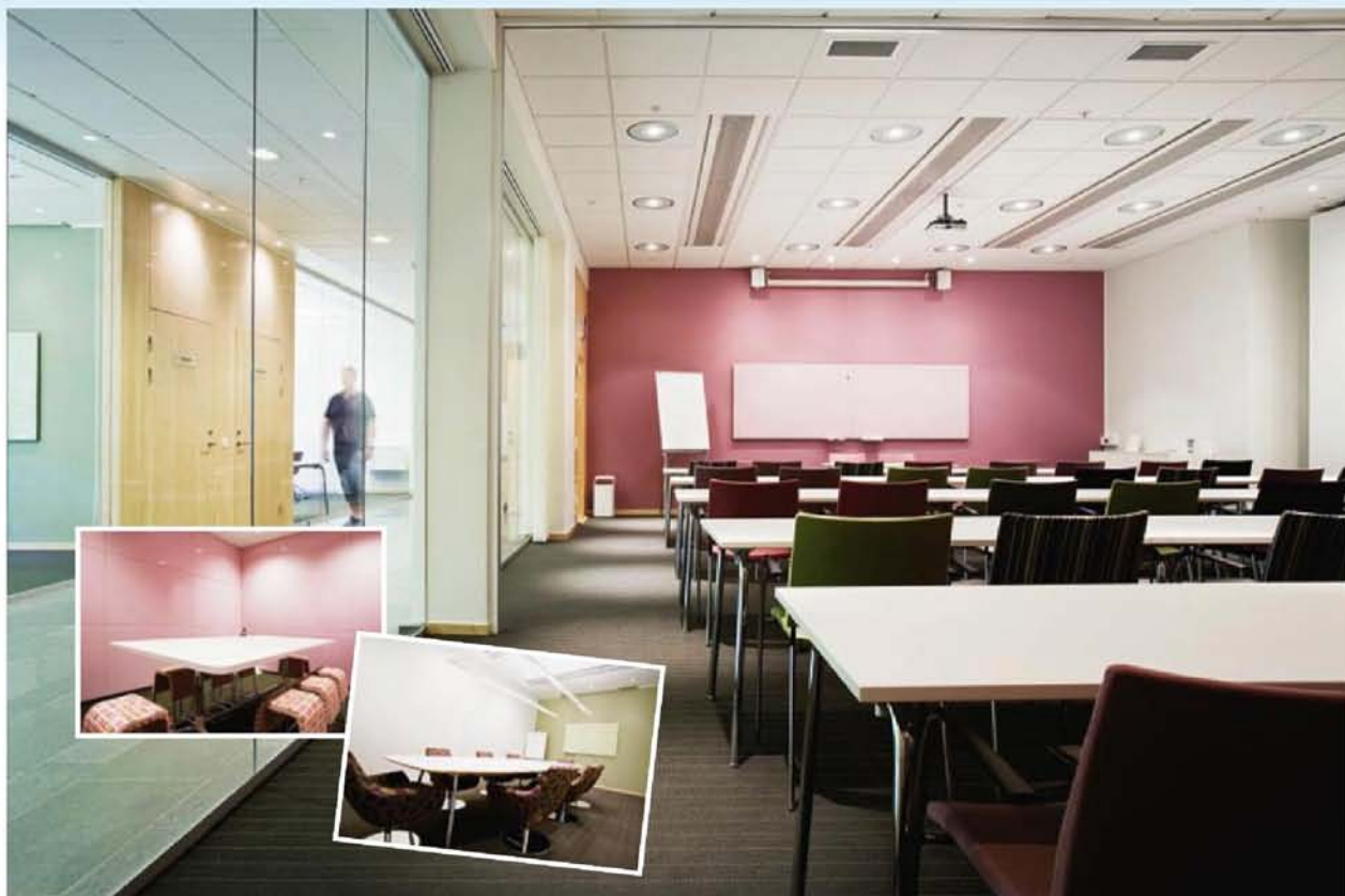
Solna Gate har en egen konferensanläggning med en mängd mötesrum med plats för alltifrån 8 personer upp till 255 personer. Mötesrummen har fått namn efter kända tv-serier såsom exempelvis "Dallas" och "Baywatch". Det kreativa rummet "Desperate Housewives" är inrett helt i rosa, med glasväggar som du kan skriva på.