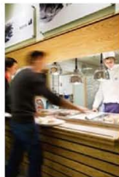
Husets nya restaurang, Terra Solna Gate.

Cirka 1 200 människor arbetar i Solna Gate, och lika många åter dagligen i husets nya restaurang, Terra Solna Gate (varav hälften av gästerna kommer utifrån). Fastigheten är även utrustad med en stor konferensanläggning, gym, simbassäng, motionshall, hörsal och espressobar med mera.