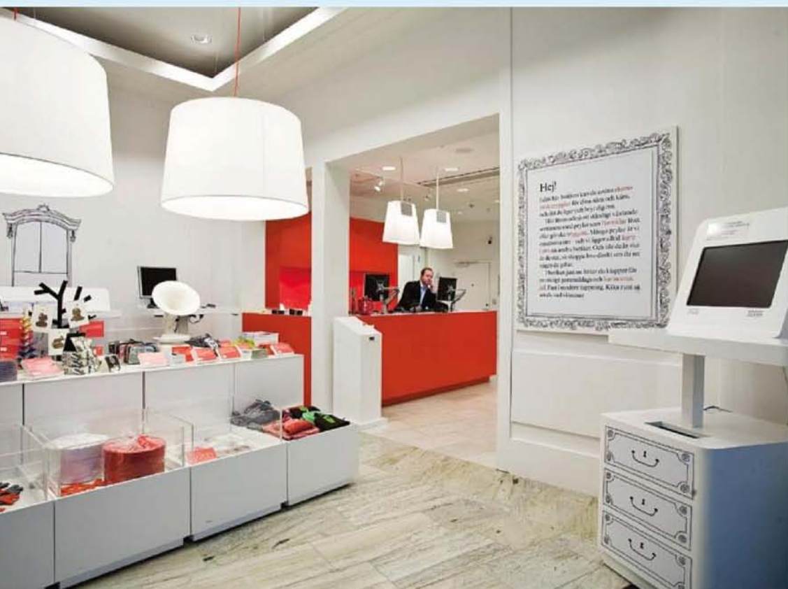
I fastigheten finns i stort sett all tänkbar service. Här finns bland annat restaurang, gym, simbassäng och motionshall. På bilden syns även en butik som drivs i Länsförsäkringars regi.