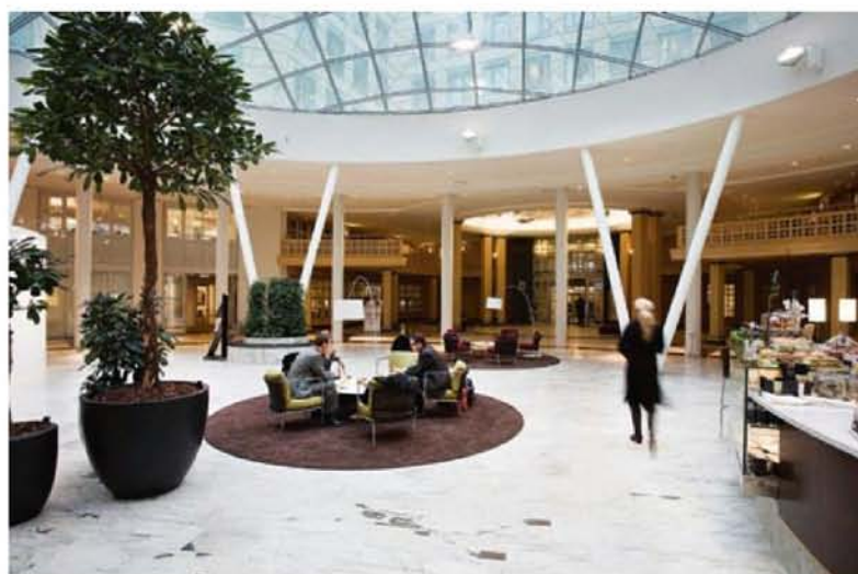
I entréhallen finns det möjlighet att slå sig ner och läsa, ta en fika, eller ha ett spontant möte.

» har kommit i första hand. Fastigheten har nu ett härligt ljus, stora öppna ytor, många konstverk i allmänna ytor, trädgård och grönytor med fruktträd och kryddgård samt uteplats vid vatten med mera. Detta anses vara viktigt inte minst ur ett Human Resource-perspektiv.